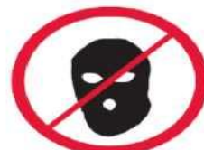
Części ubioru zakrywające twarz, kominarki