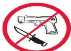
Broń, materiały wybuchowe, noże

Piktogramy odnoszące się do regulacji porządkowych wynikających z regulaminu.