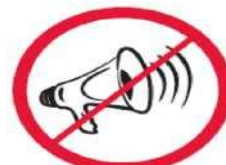
Megafony, syreny, inne urządzenia emitujące dźwięk