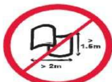
Banery lub flagi o wymiarach większych niż 2.0 m x 1.5 m.