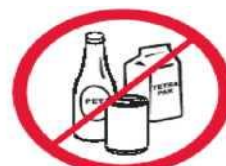
Butelki, puszki, kubki, dzbanki