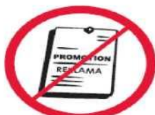
Przedmioty, materiały, ubrania komercyjne i promocyjne