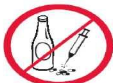
Napoje alkoholowe, narkotyki