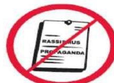
Materiały rasistowskie, ksenofobiczne, polityczne, religijne, propagandowe