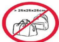
Pudła, torby, plecaki, walizki i inne wszelkie przedmioty większe niż 25 cm x 25 cm x 25 cm