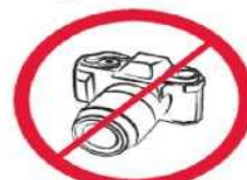
Profesjonalne aparaty fotograficzne, kamery wideo