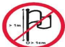
Maszty flagowe lub banerowe o większej długości niż 1 m. i średnicy niż 1 cm