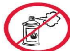
Gaz w aerozolu, substancje żrące, łatwopalne, barwniki