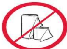
Duże ilości papieru