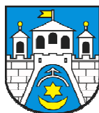
Gmina Ostrowiec Św.